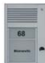
Pozivni tablo sa jednim tasterom za montažu na ulazima u objekat