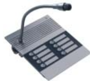
Centralna stona jedinica za pozivanje do 30 lokala