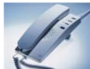
Interfonski telefon sa funkcijom razglasta i mogućnošću zvanja do 3 centralna mesta.